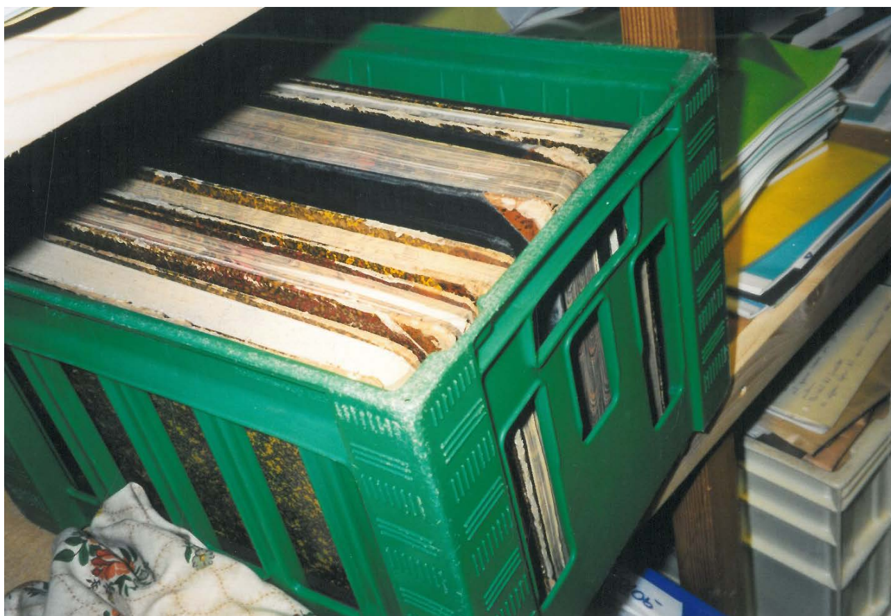
Detalje af protokoller fra Seden Enggårds arkiv.

Kontakt på E- mail: post@nymg.dk eller telefon: 66 12 49 30.