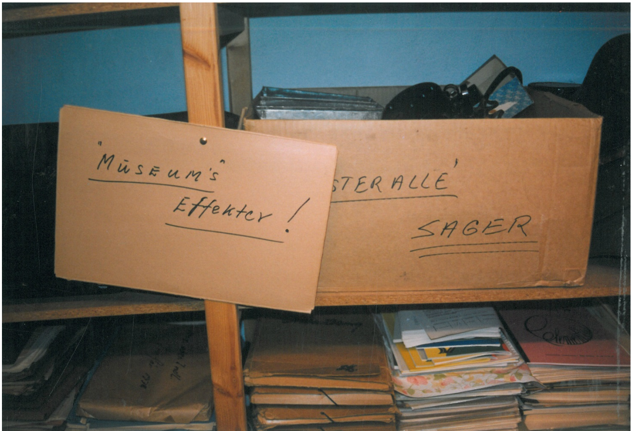
Magasin på forsorgshjemmet Østervang.

Kontakt på telefon: 86 29 22 55 eller E-mail: oestervang@aarhus.dk .