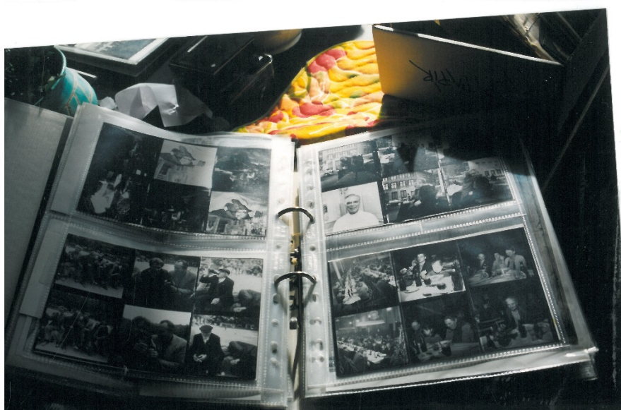
Album med fotografier fra Missionen blandt Hjemløse.

Kontakt på telefon: 36 16 11 13 eller E-mail: mbh@hjemlos.dk .