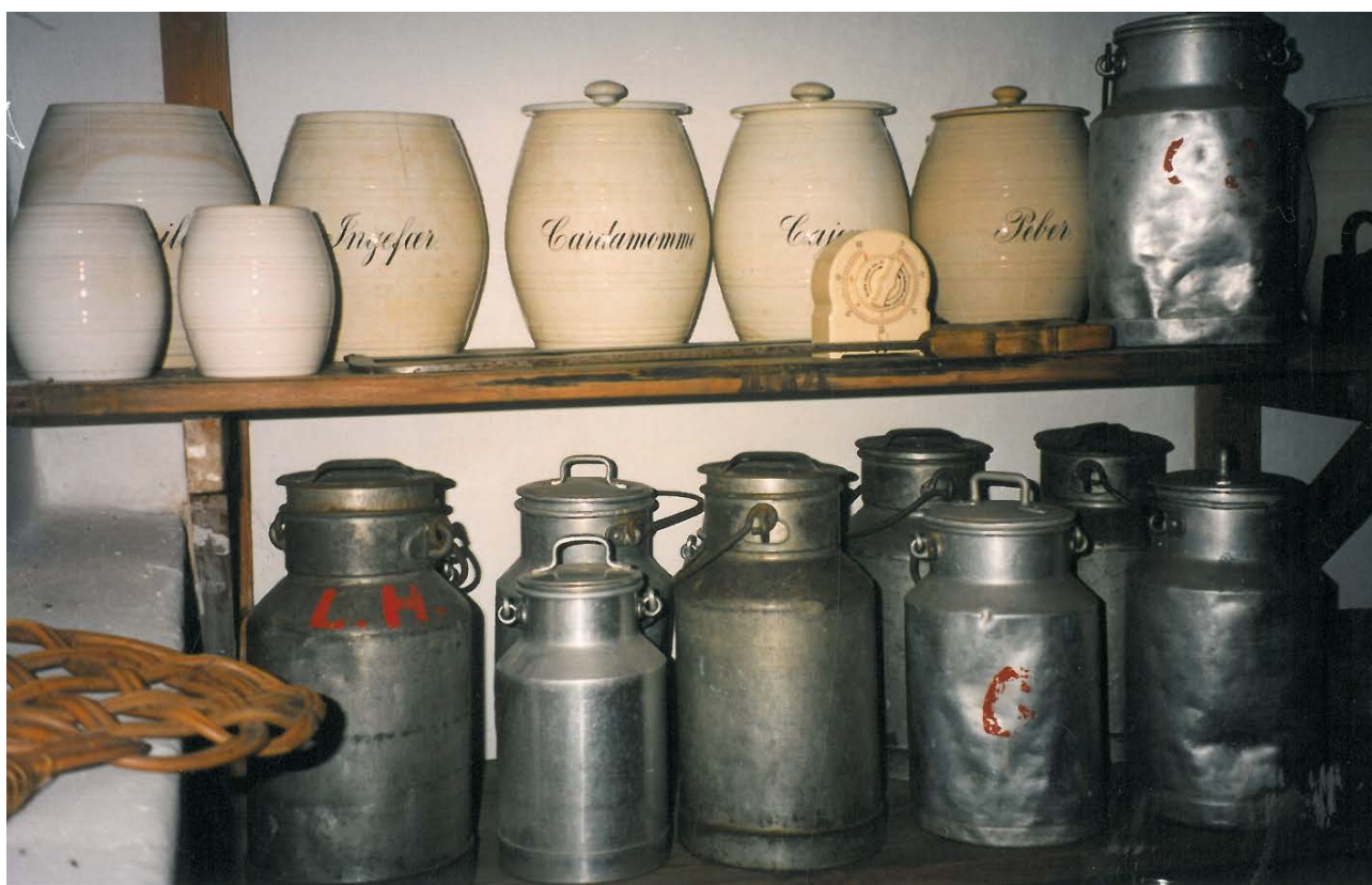
En del af Himmelbjerggårdens samling af køkkenudstyr.