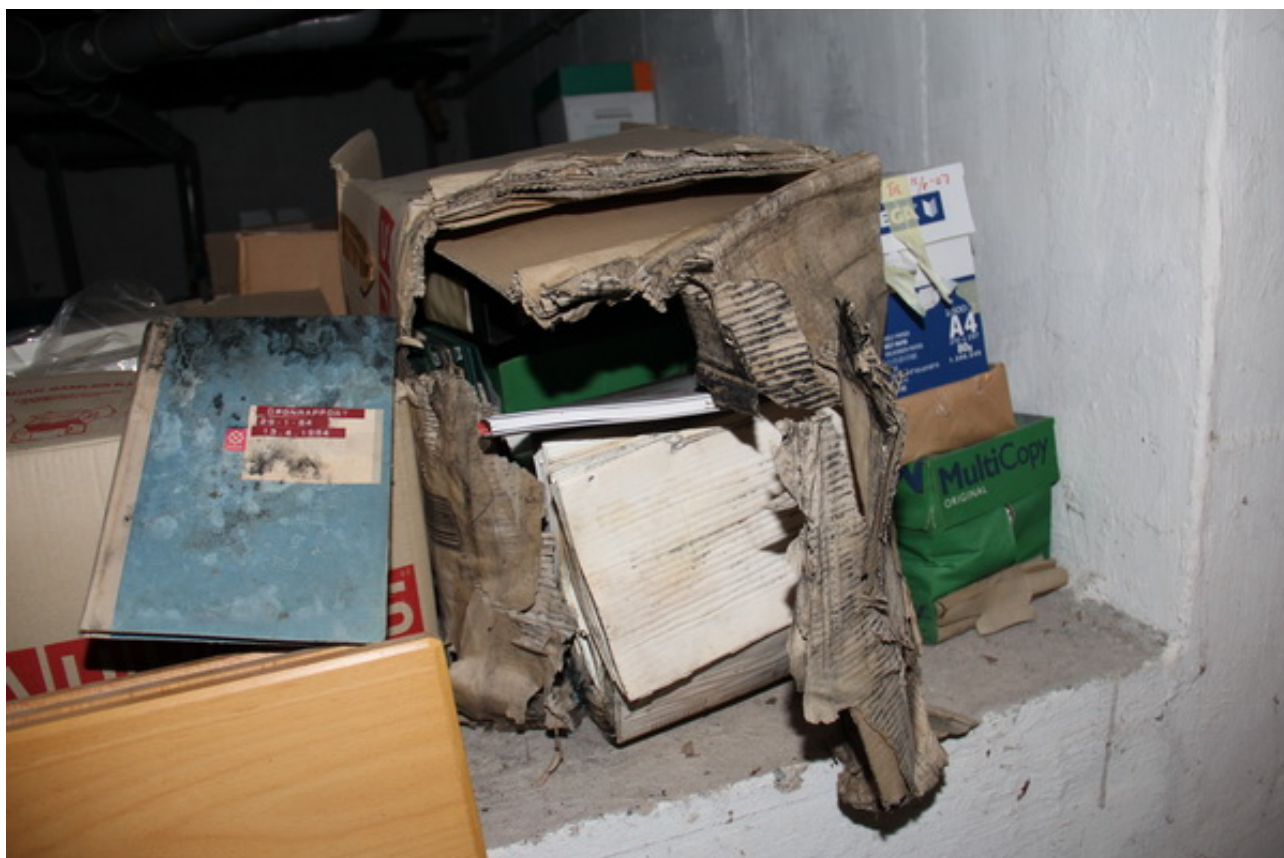
Et skrækeksempel på hvad der kan ske, når midlerne og opmærksomhed ikke er til stede. Materialet stammer fra et forsorgshjem i Danmark.

Ofte er de etableret i forbindelse med en tidligere eller nuværende institution og er drevet af tidligere medarbejdere og frivillige kræfter; ildsjæle, der brænder for hvert deres område. Ofte drejer det sig om tidligere personale såsom plejere, diakoner, omsorgsassister osv. De deler alle en fælles drøm om at bevare historien om deres gamle arbejdsplads og forsorgsområde samt give "en historieløs gruppe deres historie" 2 . De frivillige kræfter er en styrke for de små museer og samlinger, men det er også samtidig deres svaghed. Fremtidsudsigterne for disse museer og samlinger er ofte usikre, og den manglende professionalisering giver nogle åbenlyse udfordringer i forhold til bl.a. opbevaring og registrering. Tilfældigheder præger til en vis grad arbejdet, og det er tydeligt, at de mangler både professionel sparring og vejledning. Som det er nu, står og falder historien om den enkelte genstand, dokument, foto eller lignende, med tilstedeværelsen af en 'ildsjæl', og hvis den pågældende ildsjæl forsvinder, dør historien med ham eller hende.