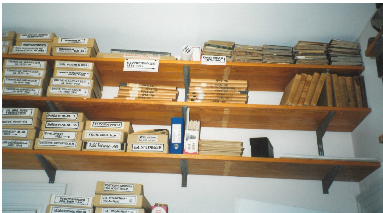
En del af arkivet fra det tidligere Skolehjem Holsteinsminde.

Kontakt på E-mail: hjortholm-kostskole@gentofte.dk eller telefon: 30 10 07 00.