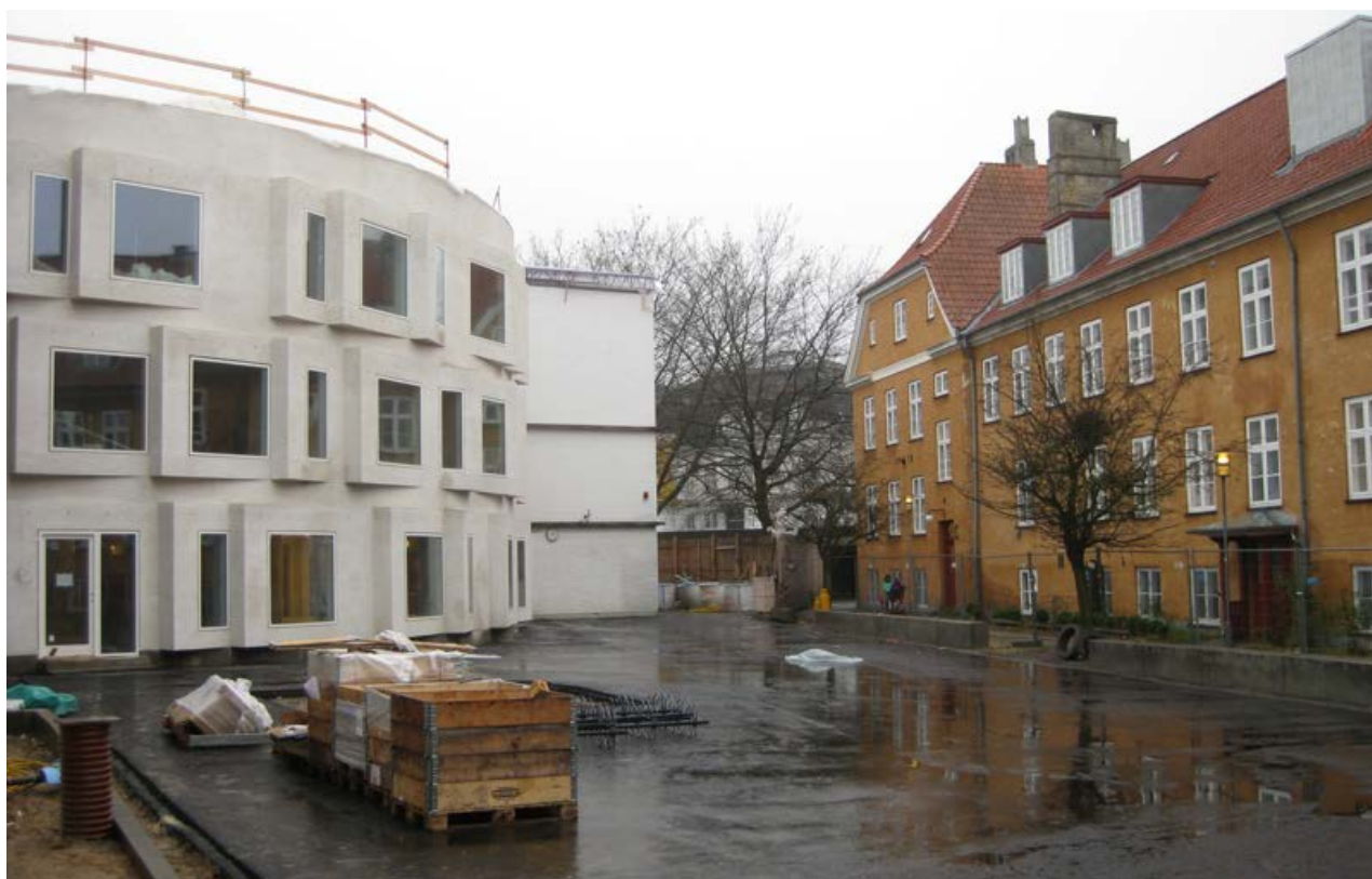
Døveskolens bygninger på Kastelvej.