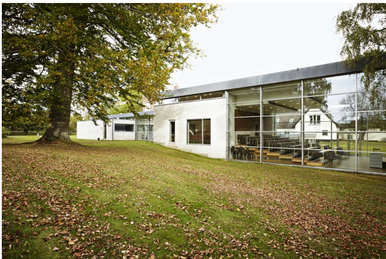
Eriksholms nye tilbygning fra 2001 med plads til museum.