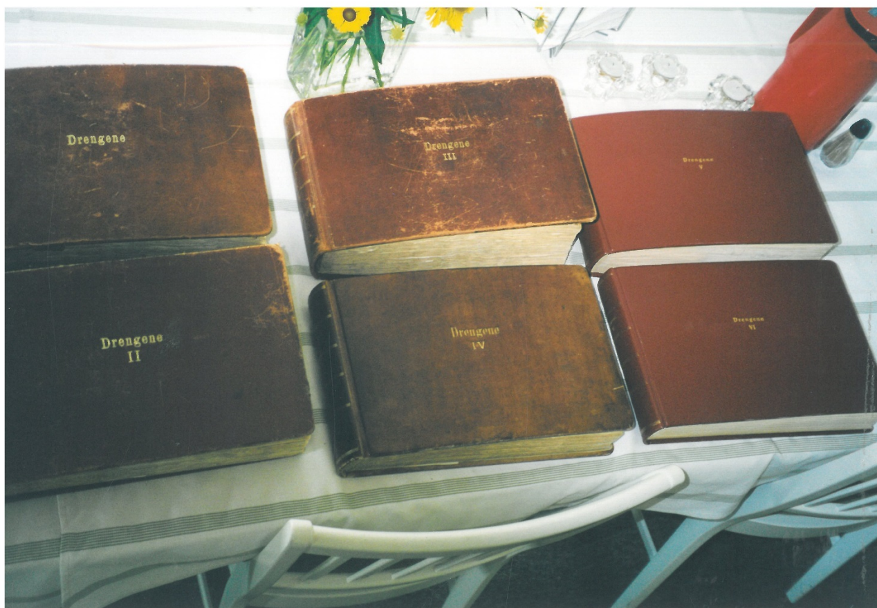
Fotoalbums med portrætter fra Landerupgård Opdragelseshjem.

Kontakt på E-mail: landerupgaard@kolding.dk eller telefon: 75 56 23 66.