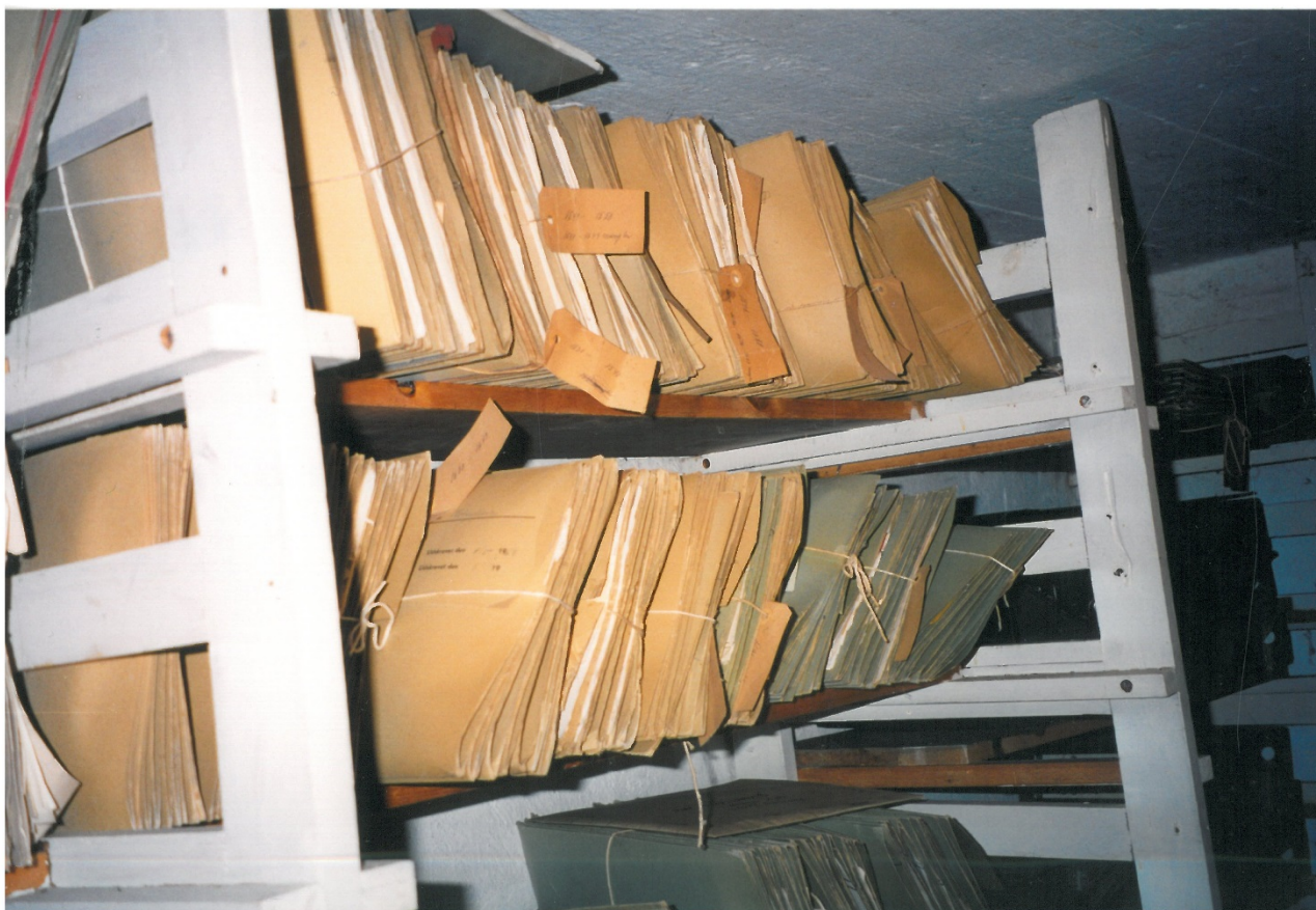
Godhavns store arkiv går helt tilbage til oprettelsen i 1893.

Kontakt på E-mail: godhavn@godhavn.dk eller på telefon: 48 70 70 08.