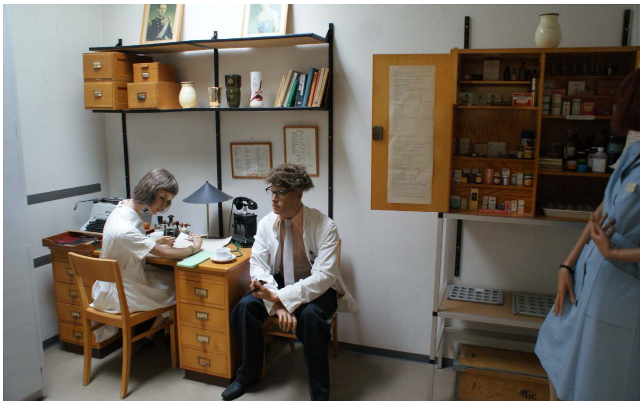
Fra museumsudstillingen på Andersvænge.