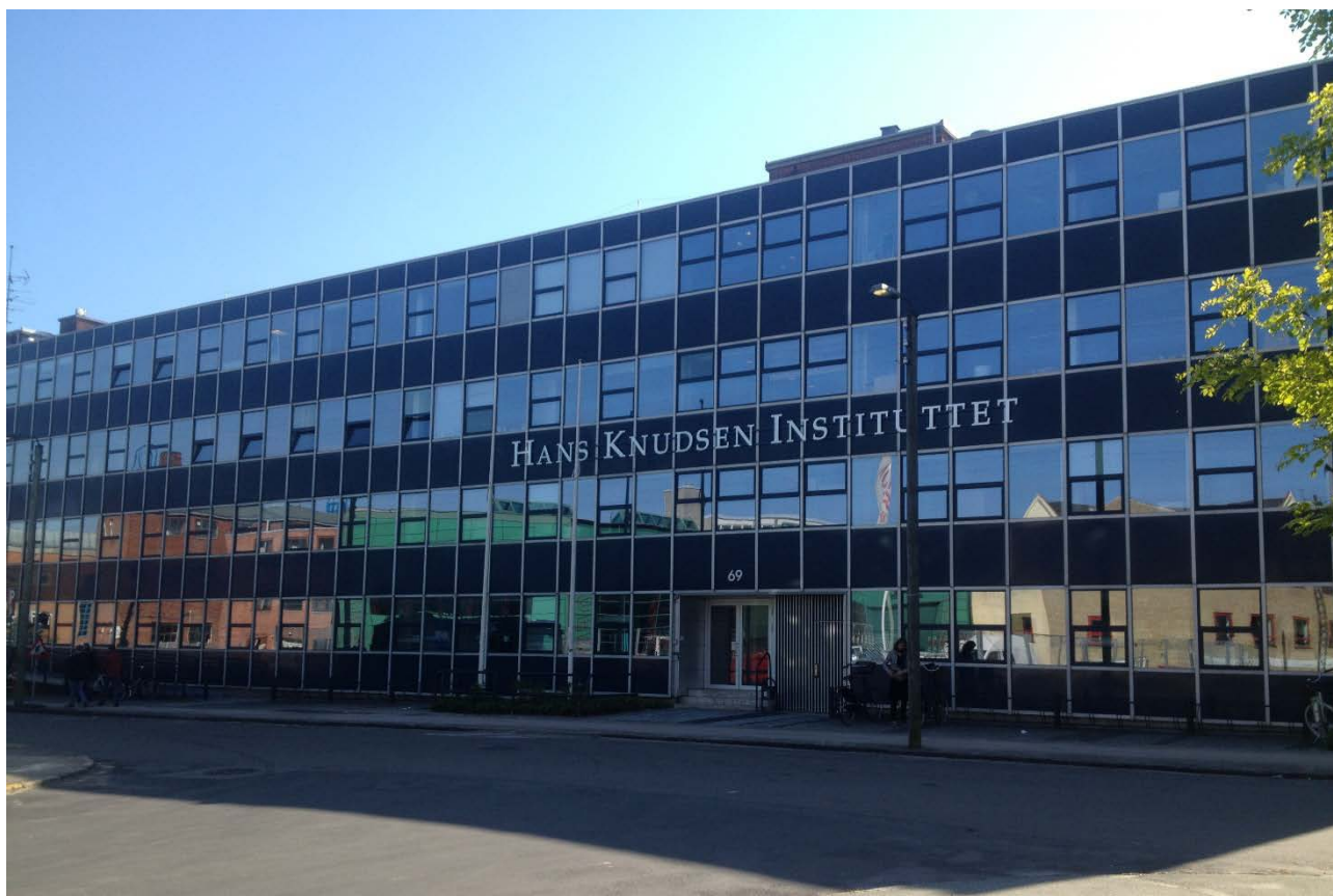
Hans Knudsens Institut på Glentevej i København.